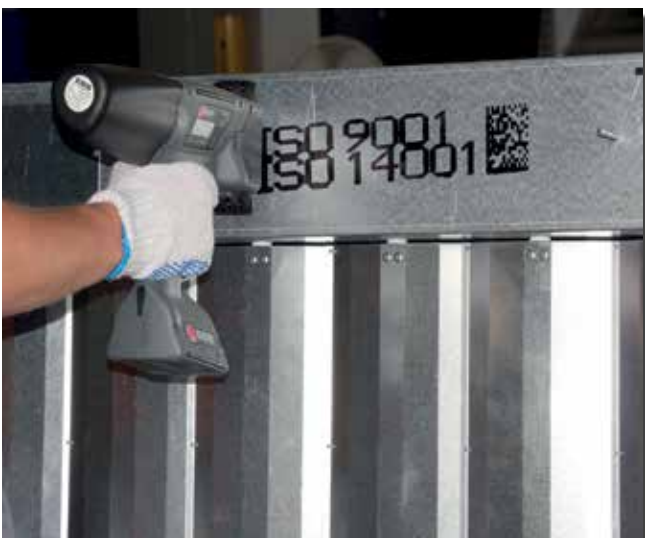
Druck auf Stahl mit schwarzer Universaltinte 2D Barcode

Die EBS Ink Jet Systeme GmbH entwickelt seit 1977 führende, industrielle Drucksysteme und deren Verbrauchsmittel. Wir fertigen ausschließlich in Europa selbst und sind in 56 Ländern vertreten.