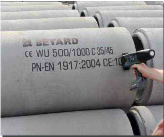
Druck auf Betonteilen mit schwarzer Spezialtinte für höhere UV Resistenz