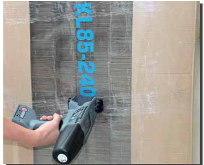
Druckt auf Stretch Folie mit pigmentierter Tinte