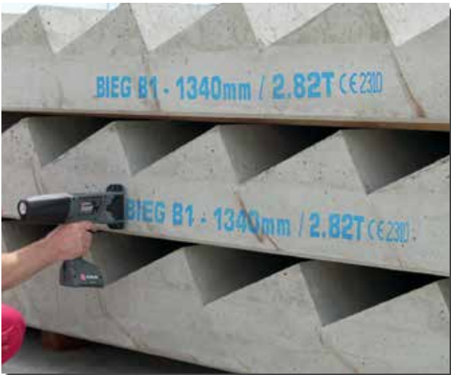
Druck auf Betonteilen mit blauer pigmentierter Tinte