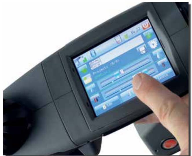
Kontrolle und Eingabe am Touchscreen

Druckt TrueType Emulation auf Kunststoff mit schwarzer Acetontinte