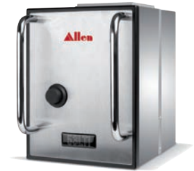
Druckkopf mit integrierter Steuerung

Einfach zu bedienender, robuster Druckkopf in edlem Design